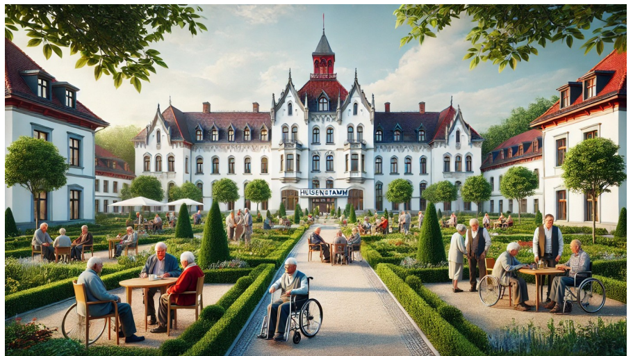
Text und KI-Bild Hartmut Scharmann