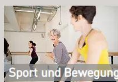
Sport und Bewegung