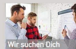
Wir suchen Dich