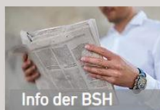
Info der BSH